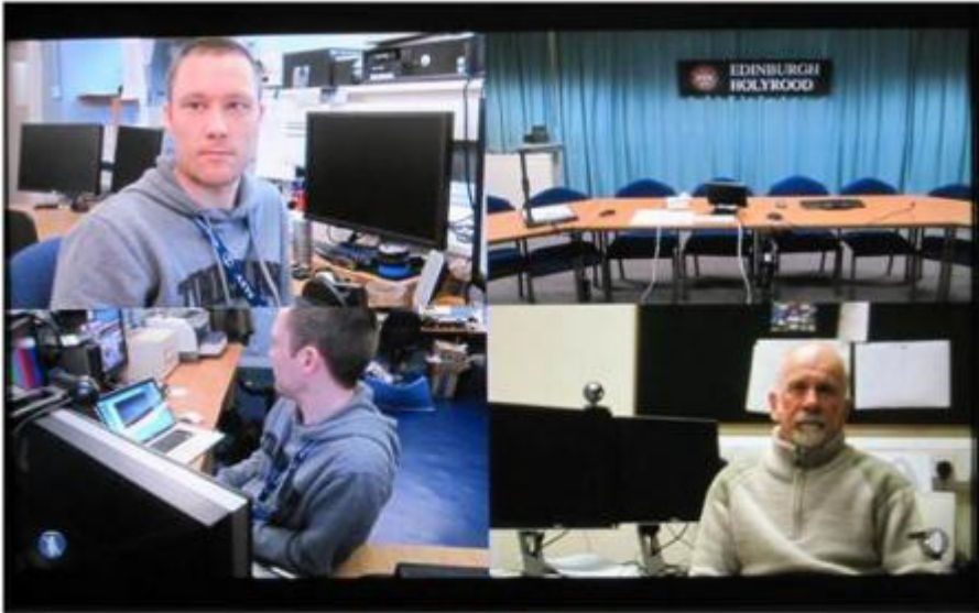
Four Sites Quad Split