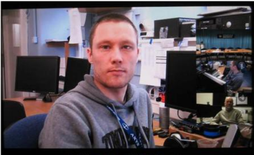
Full Screen Site with Multiple PIPs