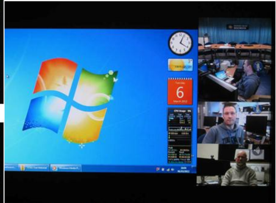
Presentation Large with Four Sites video POP images

S počtem účastníků NErostou nároky na stanice